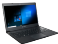
Sichtschutzfilter (selbsthaftend) (PX1907E-2NAC)