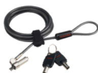
Ultraschlankes Notebookschloss mit Kabel (PA5288U-1KCL)